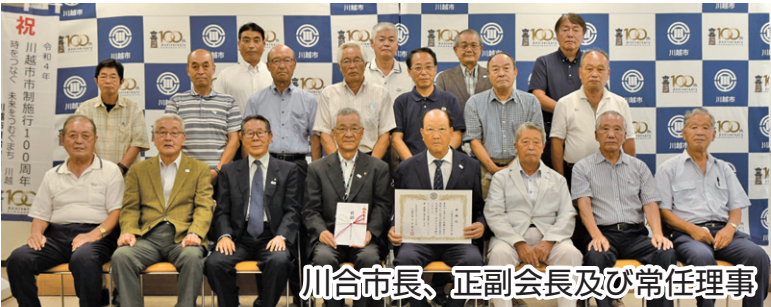
川合市長、正副会長及び常任理事

自治会連合会は今後も市と協力して市制施行100周年を大いに盛り上げてまいります。