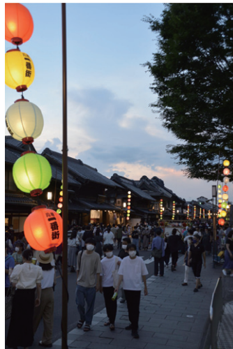
日が沈むにつれ、提灯に明かりがともり川越の町並みを美しく彩りました。