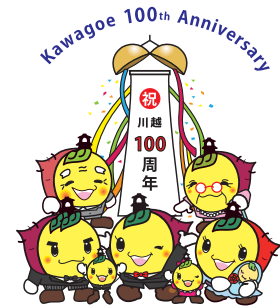
川越市マスコットキャラクターときも