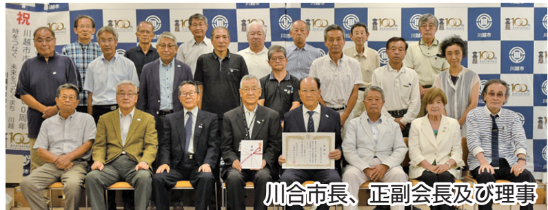
川合市長、正副会長及び理事