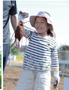
たくさん収穫できました