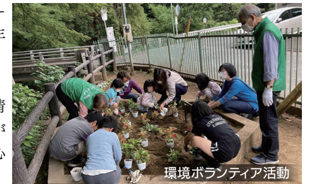
環境ボランティア活動

第5支会は、年に3回の自治会長会議を開催し情報交換の場を設けておりますが、今後も各自治会が活発に活動できるよう連絡を密に取り、安全で安心して暮らせるまちづくりに努め活動して参ります。