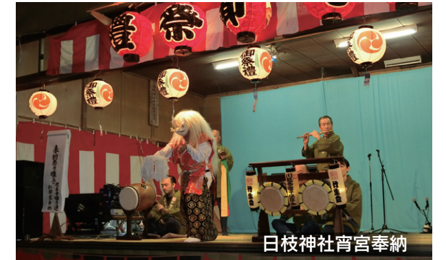
日枝神社宵宮奉納

各自治会の活動は、地域コミュニティ活動として小仙波町1丁目と西小仙波町1丁目は餅つき大会、小仙波町3丁目・小仙波町4丁目・西小仙波町2丁目は夏祭り、朝日マンションはクリスマス会、小仙波町公民館と西小仙波町1丁目は盆踊り会などを開催しています。また、小仙波町では公民館を中心に体育祭もおこなっています。地域の見守りとして、小仙波町2丁目では「黄色ハチマキ」を使った安否確認訓練や、西小仙波町1丁目と2丁目は民生委員が中心となり合同で日常生活で手助けが必要な高齢者向けに生活支援サポート事業(サポート西小)もおこなわれています。又、西小仙波町2丁目は振り込め詐欺等犯罪撲滅の為に、管内の数か所に防犯カメラを設置し、警察と連携して住民の安全をサポートしています。